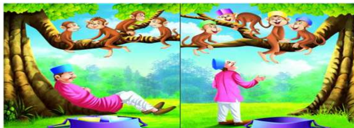
एक टोपी वाला जंगल के रास्ते जा रहा था चलते चलते उसे बकान लगी और वह पेड़ के नीचे सो गया उस पेड़ पर बहुत बंदर थे उन्होंने उसकी सारी टोपियां पहन लीं

गतिविधि 13. बच्चों चित्रों को देखते हुए आपको इस कहानी को पूरा करना है।