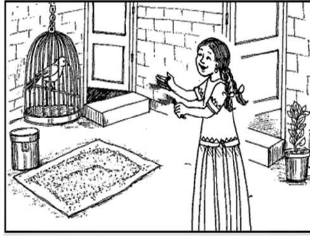
इस चित्र में अपनी पसंद से रंग भरिये

एक लड़की थी। उसका नाम गुड़िया था। गुड़िया ने एक तोता पाला। उसका नाम रखा मोती। मोती भूखा था, वह जोर जोर से टें-टें करने लगा। टें-टें सुनकर गुड़िया दौड़ी आयी। उसने मोती को हरी मिर्च दी। मिर्च खा कर मोती और गुड़िया खेलने लगे।